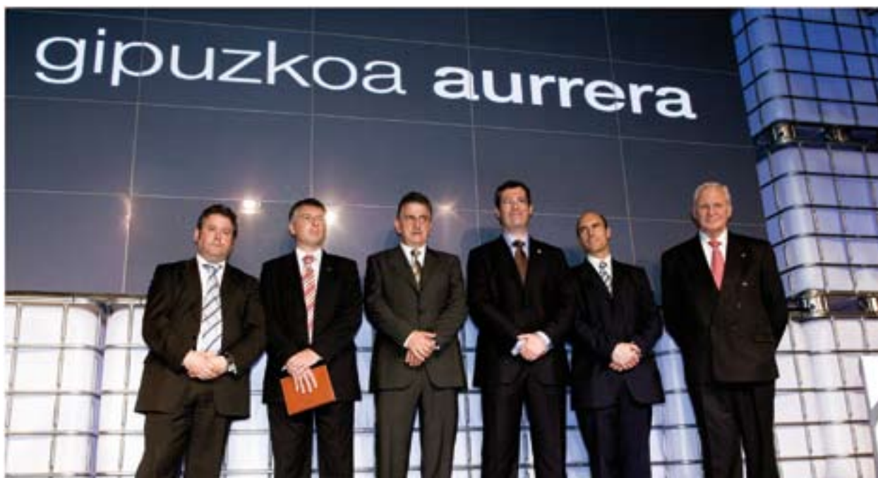
18.06.08. Constitución iniciativa Gipuzkoa Aurrera.