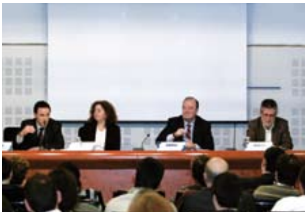
20.02.08. ADEGI y BIC BERRILAN celebran un encuentro con medio centenar de nuevas empresas en el marco de su colaboración en el impulso del emprendizaje.