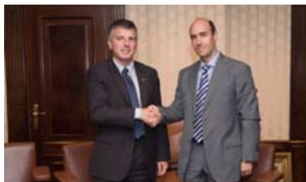
07.10.08. KUTXA y ADEGI firman un acuerdo de apoyo a la liquidez de las empresas guipuzcoanas.