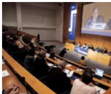
29.05.08. Asamblea General de ADEGI.