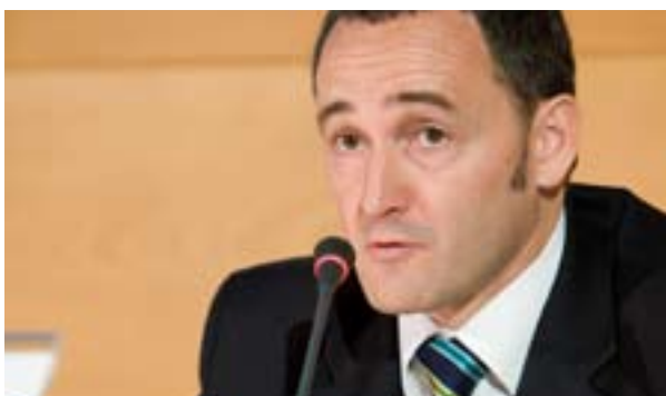
11.09.08. ADEGI muestra su plena satisfacción con la sentencia del tribunal europeo de Luxemburgo que confirma y avala el concierto económico y la capacidad fiscal de los territorios históricos.