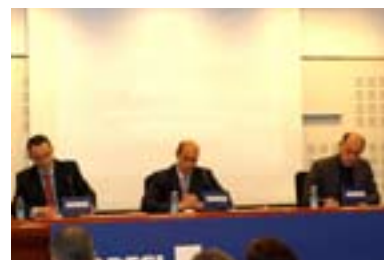
30.09.08. Para las empresas guipuzcoanas el presente es el peor momento económico de los últimos 15 años.