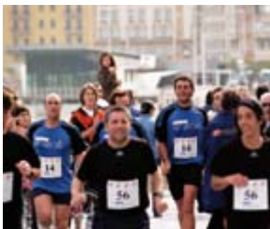
11.05.08. 1ª Carrera de Empresas en Donostia-San Sebastián.