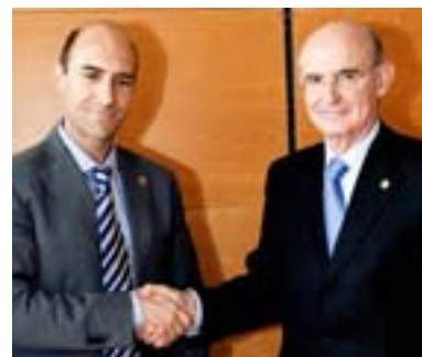
29.05.08. ADEGI e INNOBASQUE trabajarán juntos en el emprendizaje empresarial e innovación.