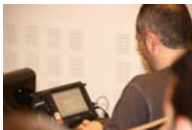
08.09.08. ADEGI pone en marcha "Talleres en Red para Líderes en Innovación" nuevo programa que quiere llevar la innovación a las Pymes.