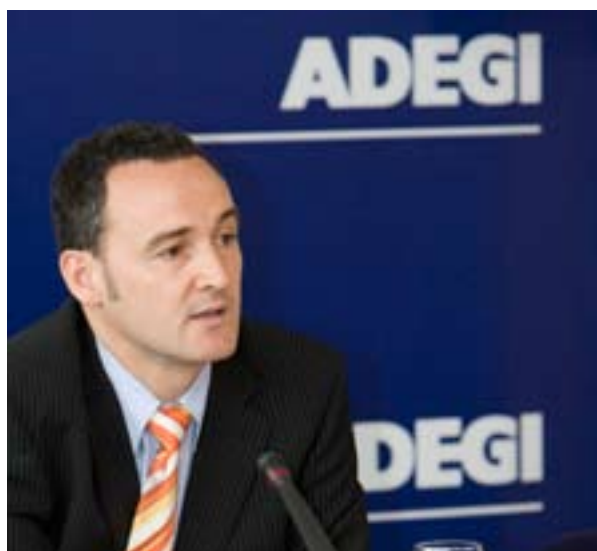
18.12.08. ADEGI valora muy positivamente la aprobación del nuevo impuesto de sociedades porque favorece la competitividad de las empresas en un momento de fuerte crisis.