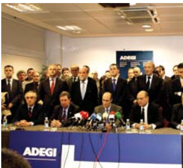
03.12.08. Declaración institucional de ADEGI ante el asesinato de Inaxio Uria.