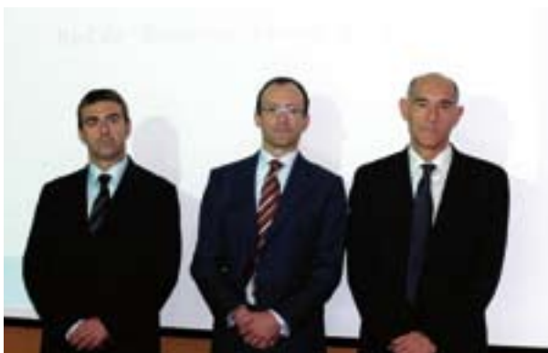
23.10.08. Presentación de BAN Euskadi, la red vasca de Business Angels.