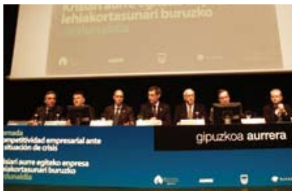
02.12.08. Jornada sobre competitividad empresarial ante la crisis.