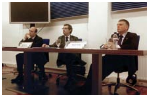
27.10.08. Primer encuentro empresarial dentro del marco Gipuzkoa Aurrera.