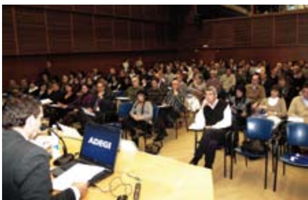
20.11.08. Jornada sobre expedientes de regulación de empleo.