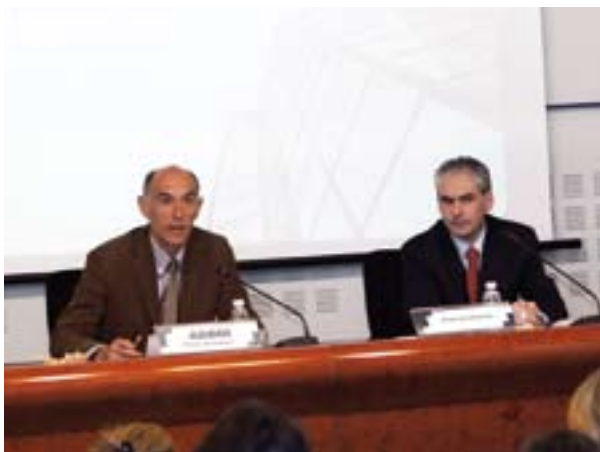
24.04.08. Trescientas empresas analizan en sendas jornadas en ADEGI las exigencias del nuevo Plan General de Contabilidad.