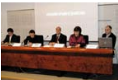
09.06.08. ADEGI presenta e-Gerentes, programa único e innovador en el estado dirigido al desarrollo de líderes empresariales.